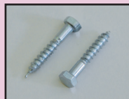
A-Nr.: 57706 inkl. 2 Holzschrauben

Preis: 4,18 EUR EUR / Stück in VPE inkl. 7 % MwSt. und inkl. Versand