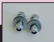
A-Nr.: 57705 inkl. 2 Metallschrauben