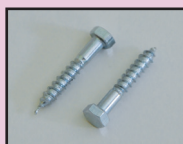
A-Nr.: 57707 inkl. 2 Holzschrauben

Preis: 3,78 EUR / Stück in VPE inkl. 7 % MwSt. und inkl. Versand